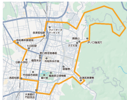
<どこでもバスの運行エリア>