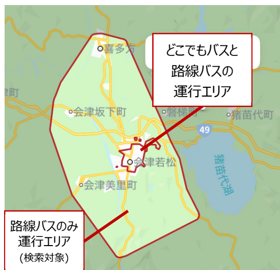
<検索対象エリア（アプリ画面）>

上記を一覧で確認でき、複数の選択肢の中から、利用者の都合に合ったルートを“えらべる”ようになります。