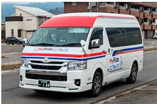
<どこでもバスの車両>