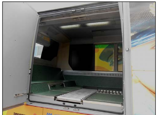
【荷台スペースの写真】