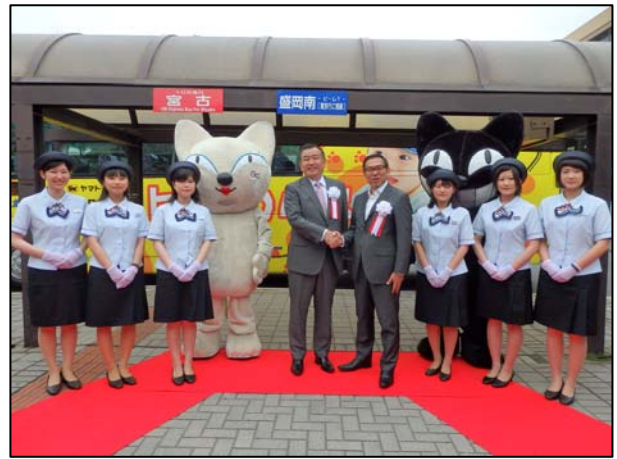
岩手県北バスのバスガイドとヤマト運輸のキャラクター「シロネコ、クロネコ」に囲まれ握手する長尾社長（中央左）と松本社長（中央右）